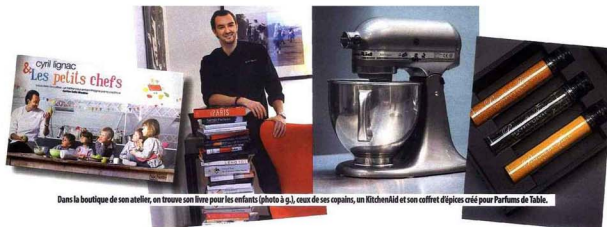
Dans la boutique de son atelier, on trouve son livre pour les enfants (photo à g.), ceux de ses copains, un KitchenAid et son coffret d'épices créé pour Parfums de Table.

C'est dans son atelier de création, qui vient tout juste d'ouvrir ses portes, CuisineAttitude ®, au cœur de Paris, que Cyril Lignac s'est installé dans un superbe espace ouvert de 260 mètres carrés. Ici, la star du lieu c'est la cuisine ! Centrale, mise en scène, éclairée naturellement par une verrière, et spécialement dessinée par Bulthaup. Quand il n'est pas dans ses restaurants, ni sur un plateau d'enregistrement pour M6 « Top Chef », il y passe tout son temps. Entre essais de recettes et cours de cuisine consacrés au public, Cyril Lignac nous ouvre les portes de son nouveau frigo Electrolux.