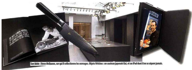
Son idole : Steve McQueen, sur qui il collectionne les ouvrages. Objets fétiches : un couteau japonais Kai, et un iPad dont il ne se sépare jamais.

de bonbons de chocolat, en passant par son sublime praliné, j'admire le travail de cet artiste du chocolat, qui est aussi devenu un ami.